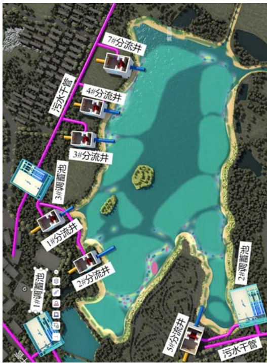
图2 汤湖智能分流井与调蓄池布置图

协同效果评估: 经实际运行监测, 排水管网溢流次数减少75%。水体污染指标如COD、总磷、氨氮、总氮等明显下降, 结合水生态的修复作用, 两年内, 水质由劣V类转化为IV、III类, 是真正意义上治理好的湖泊。